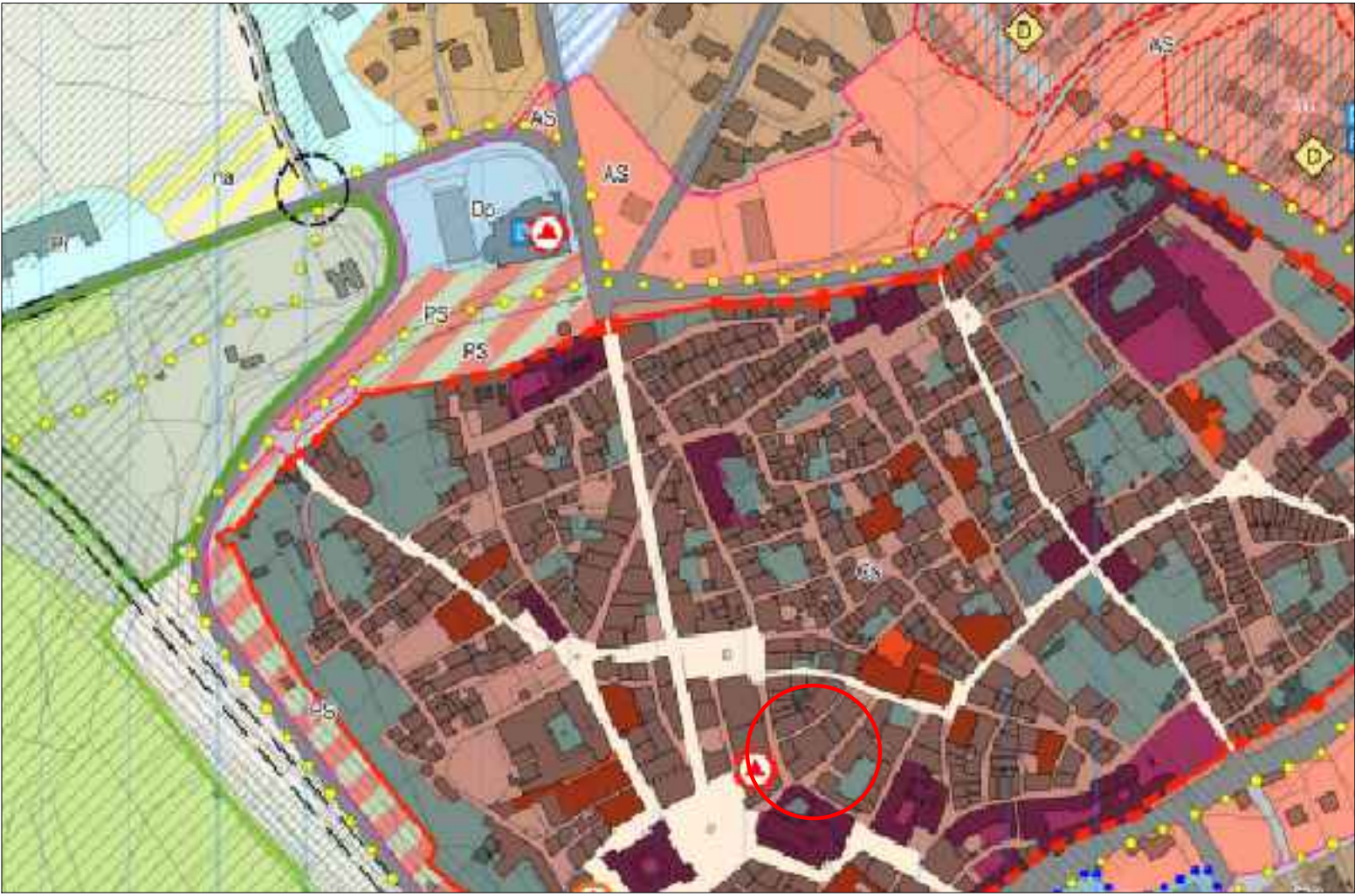
PRG - PO